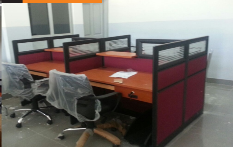
Área do Staff