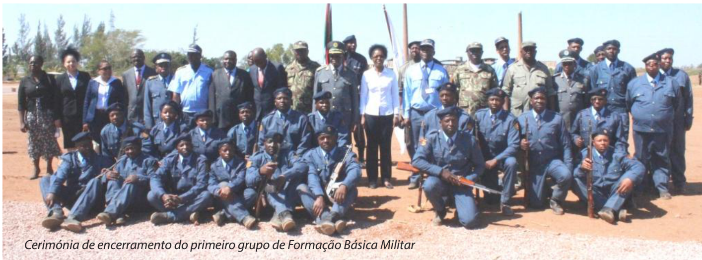
Cerimónia de encerramento do primeiro grupo de Formação Básica Militar

Veja a grande entrevista na próxima edição de BT